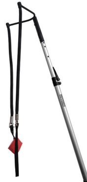
#5490 Rocket Master