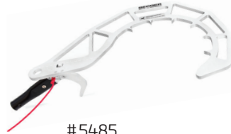
#5485 Absetzhaken Felling hook crochet d'abattage