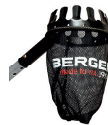
#5440 Obstpflücker Fruit picker Cueille-fruits