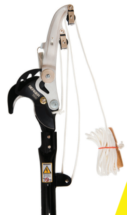
#5430 Raupenschere Pole Pruner échenilloir