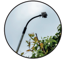
#5462 Media Adapter Flexarm adaptateur média avec bras flexible (Camera not included)